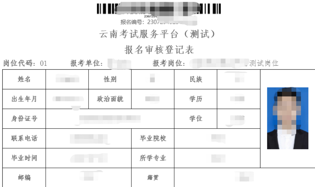
(图例：考生查看或打印自己的报名表)