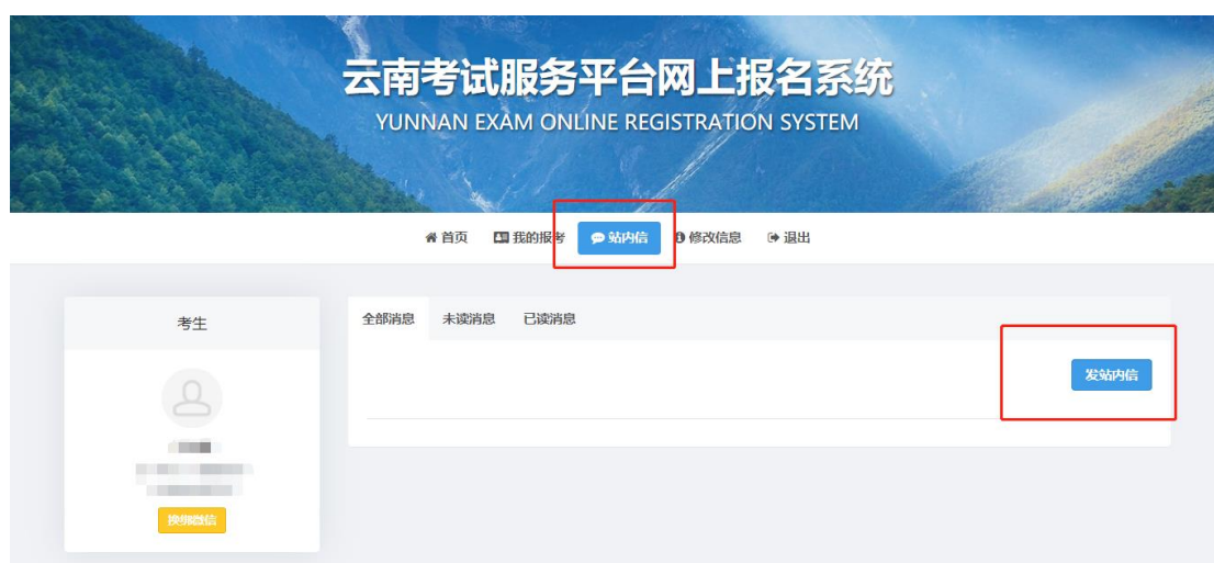
(图例：站内信发送方式)